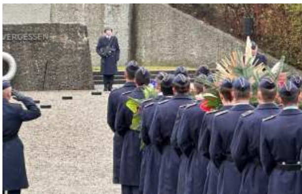
Kranzniederlegung am Luftwaffenehrenmal .